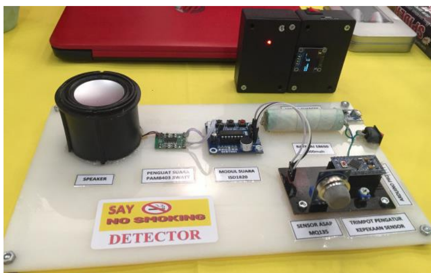
Gambar 3: Alat Sistem Kontrol Pendeteksi Asap Rokok

Alur kerja sistem kontrol pendeteksi asap rokok dimulai dari tahap input, yaitu sensor MQ-2 yang mendeteksi keberadaan asap atau gas di udara. Sensor ini mengubah kadar asap menjadi sinyal listrik (analog/digital) yang kemudian dikirim ke mikrokontroler Arduino Uno. Pada tahap proses, mikrokontroler membaca dan mengolah data dari sensor berdasarkan program serta ambang batas yang telah ditentukan. Jika kadar asap masih di bawah batas aman, sistem akan menunjukkan kondisi normal. Namun, jika melebihi ambang batas, sistem akan mengaktifkan peringatan. Alat system control dapat dilihat pada Gambar 3 berikut ini.