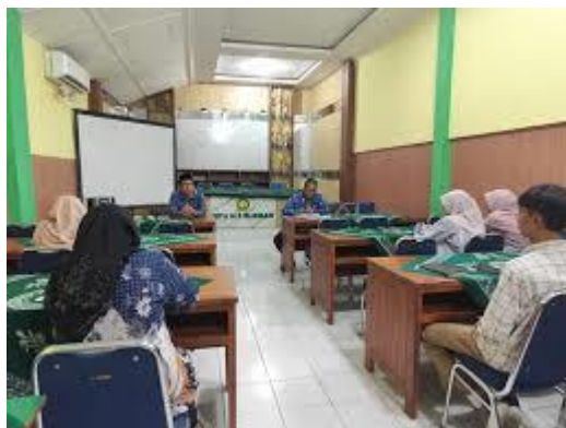
Gambar 4: Pelatihan di Aula Serbaguna Sekolah

Berikut ini suasana pelatihan yang dihadiri oleh semua staf TU di Mts Salafiyah. Hal ini dapat dilihat pada Gambar 4